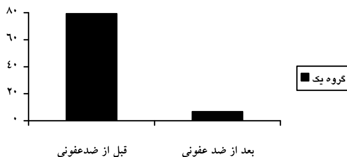
نمودار ۱: میانگین نمره شمارش کلنی میکروبی قبل و بعد از ضد عفونی در گروه یک (ضد عفونی با ایزوپروپیل الکل ۷۰ درصد)

عمده‌ترین آلودگی قبل از ضدعفونی گوشی‌ها استافیلوکوک کواگولاز منفی ( 59/3 درصد) تشخیص داده شد. در مطالعه مارنیلا، مالوف و همکاران و نوبهار نیز عمده‌ترین میکروارگانیسم به ترتیب با شیوع ۱۰۰ درصد، ۵۱ درصد و ۵۰ درصد استافیلوکوک کواگولاز منفی تعیین گردید (۳، ۷ و ۱۴). میانگین شمارش تعداد کلنی‌های میکروبی در دیافراگم گوشی‌ها در این مطالعه در گروه یک 79/31 \pm 43/3 و در گروه دو معادل 76/66 \pm 40/9 بود